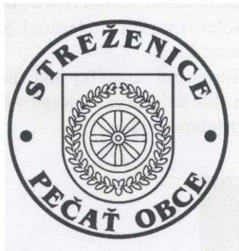
Obecná pečať s kruhopisom

Pečať obce je okrúhla, uprostred s obecným symbolom a kruhopisom OBEC STREŽENICE s priemerom 35mm.