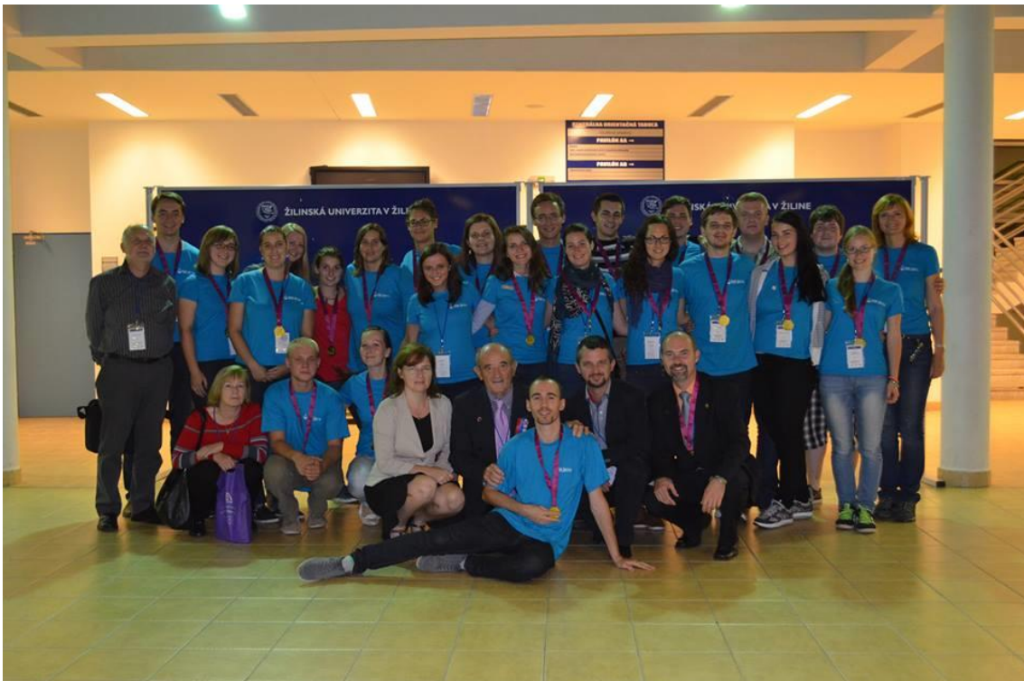
Tím dobrovoľníkov, zabezpečujúcich prehliadku projektov mladých vedcov z celej Európy - ESE 2014.

Podujatie sa uskutočnilo v priestoroch Žilinskej univerzity v dňoch 7. – 12. septembra 2014. Žilina sa stala centrom mladých šikovných vedcov – študentov stredných škôl z väčšiny krajín Európy i mimo nej. Prehliadky sa zúčastnilo 300 účastníkov z 24 krajín vrátane Slovenska. Prezentovali 86 projektov z oblasti vedy a techniky, ktoré zvíťazili na národných súťažiach. Na podujatí sa celkom spolupodieľalo 25 dobrovoľníkov z celého Slovenska. Nad podujatím prevzal záštitu aj Andrej Kiska, prezident Slovenskej republiky. Mladí ľudia získali skúsenosti, vedomosti a čo je najdôležitejšie, mali možnosť predstaviť svoje práce rovesníkom, odborníkom a širokej verejnosti. ESE je príležitosťou na nadväzovanie nových medzinárodných priateľstiev a spoznávanie cudzích kultúr.