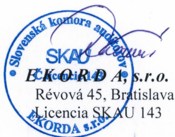
EKORDA, s.r.o. Révová 45, Bratislava Licencia SKAU 143