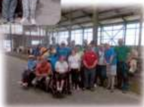
Návšteva farmy- Agrodan Koš