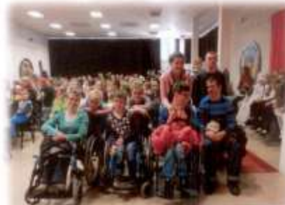
RKC –divadelné predstavenia