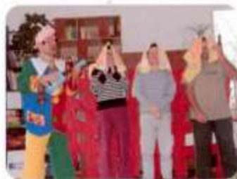
Dr.Klaun – Tri prasiatka