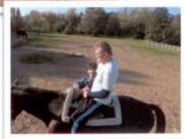
Jazdenie na koníkoch