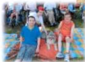
Výlet do Poruby