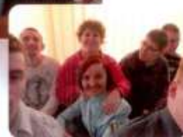
Návšteva p. primátorky mesta Prievidze