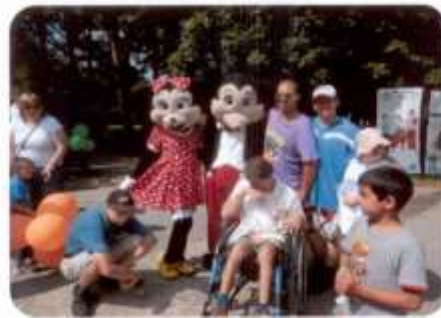
Akcia pre mentálne postihnuté deti v Prievidzi