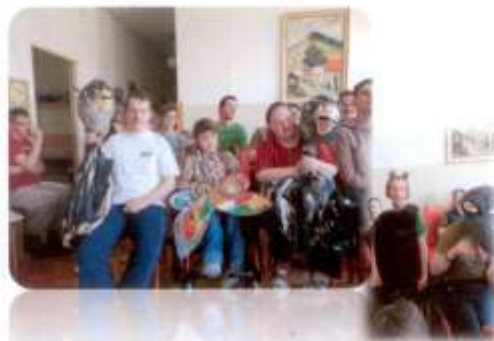
Bábkové divadlo Nováky