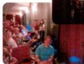
DK PD Vtáčnik - folklórny súbor