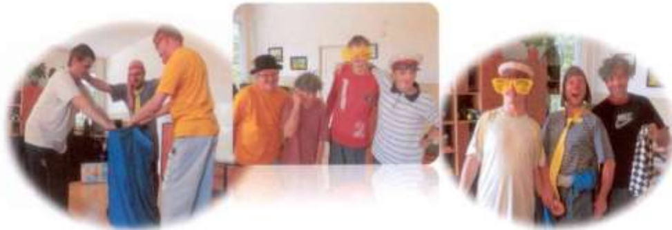
Dr. Klaun- druhá návšteva