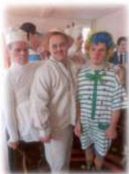
Karneval v NOVOM DOMOVE