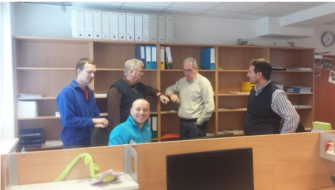
Obr. 1: Kancelária v Bratislave

Spoločnosť svoju pôsobnosť rozdelila do dvoch lokalít – do Bratislavy a Martina. Týmto firma deklarovala upevnenie svojej pozície na slovenskom trhu, potvrdila ambíciu rásť a byť bližšie k zákazníkom na celom území Slovenska.