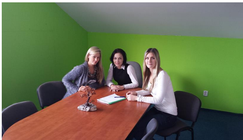
Obr. 2: Zástupcovia martinskej kancelárie

V martinskej kancelárii začalo fungovať oddelenie Tesnení a časť oddelenia Lineárna technika.