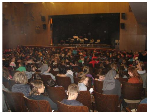
Foto: Výchovný koncert CAVALIERI

V hodnotenom období organizácia usporiadala, resp. bola spoluorganizátorom 2 súťaží a prehliadok; 50 výchovno-vzdelávacích podujatí; 78 kultúrno-spoločenských podujatí medzi ktoré patrí aj dvojdňový hudobný program usporiadaný prvý krát „Hudobné dni - Nádvorie Koruna“ a 107 iných.