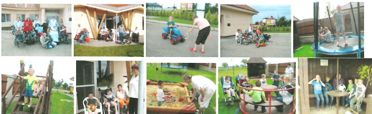
pobyt vonku na dvore

Ak je pekné počasie sme s deťmi vonku na dvore., kde máme ihrisko, prispôsobené špeciálnym potrebám našich klientov. Naši klienti radi využívajú pieskovisko, špeciálny kolotoč, špeciálna šmykľavka aj pre deti slabším telesným postihom, altánok, doinštalovali sa špeciálne ruské kolky pre vozičkárov a špeciálne loptičky BOCCIA. Vo vonkajšom areáli s chodníkmi okolo novej budovy a na bezbariérovom dvore máme trávový koberec, kde majú možnosť voľne sa pohybovať aj vozičkári. Tráva sa všetkým deťom nesmierne páči a za pekného počasia sa veľa využíva. Po chodníkoch vedú deti bicyklovať na trojkolkách. Na dvore máme aj trampolínu, ktorá je nesmierne obľúbená. Na dvore mávame pracovné činnosti, športové hry, spoločenské hry, hry s loptou, rôzne súťaže.