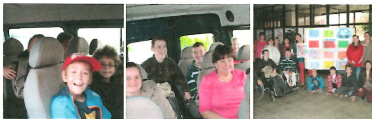
Výtvarný salón ZPMP 2014 Pezinok