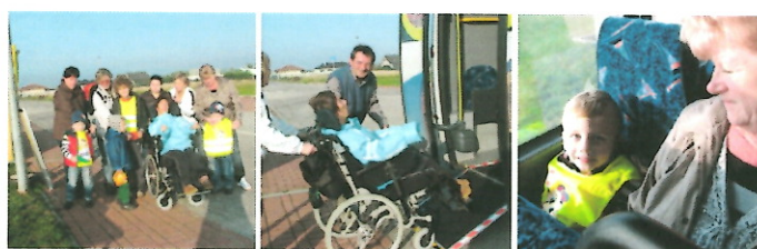
Malý výlet s MHD Senec

Všetci naši členovia bez vekového rozdielu milujú cestovanie hocíjakým dopravným prostriedkom, preto sme to dňa 9.10.2014 niektorým klientom v rámci sociálnych služieb dopriali.