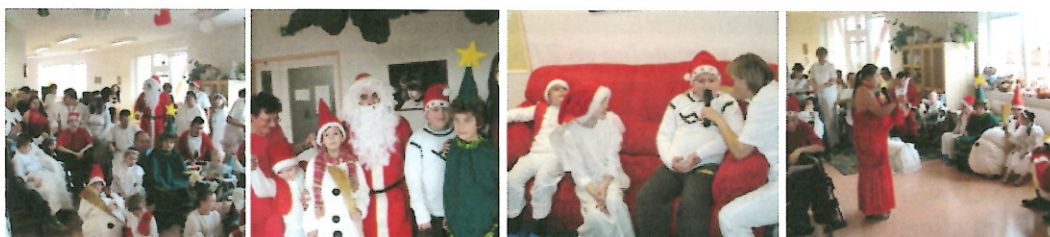
Mikuláš v Nezábudke

Aj v roku 2014 Nezábudku navštívil Mikuláš a vďaka sponzorom rozdával krásne balíčky. Podujatie bolo dôkladne pripravené, pod vedením vychovávateľky a opatrovateliek naši členovia nacvičili krásny kultúrny program a kostýmy boli vlastnoručne pripravené počas hodín pracovnej terapie. Program končil veselou tancovačkou v rámci muzikoterapie.