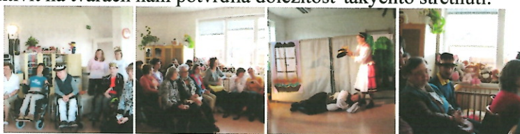
Veľké stretnutie s priateľmi zo ZPMP z Galanty