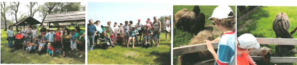
Výlet do Veľkého Medera a Zemianskej Olče

Ku dňu detí dňa 23.5.2014 sme zorganizovali poznávací zájazd spojený s rehabilitačným plávaním do Veľkého Medera, navštívili sme aj Stredisko environmentálnej výchovy DROPIE v Zemianskej Olči. Výlet bol hradený z projektu, ktorý financuje cez dotáciu Mestský Úrad Senec.