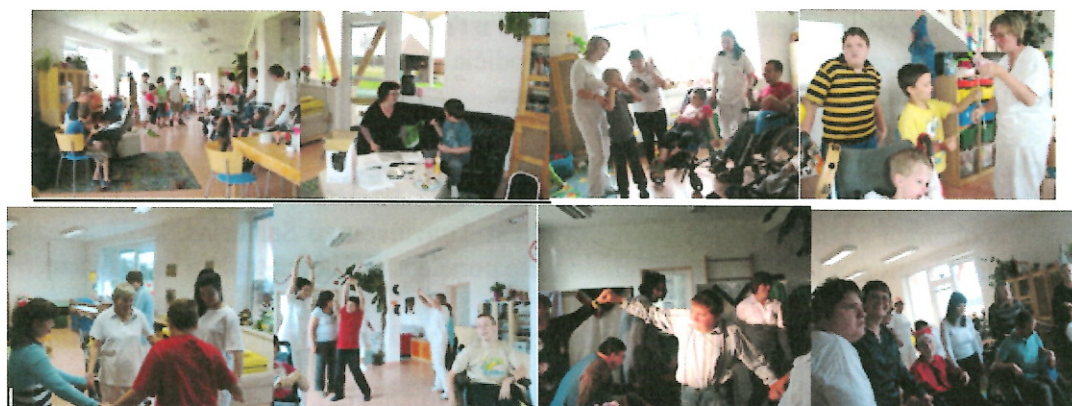
Hudobná a pohybová terapia 2014