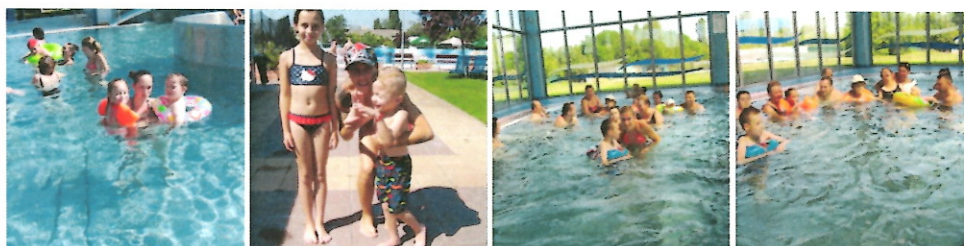
Rehabilitačné kúpanie v Galandii

Dňa 7.7. a 18.8.2014 mohli naši členovia vďaka firme DHL Logistics Senec autobusom navštíviť Termál Centrum Galandia. Veľmi nám uľahčila prácu pomoc 6 firemných dobrovoľníkov z DHL, ktorí sa priamo venovali našim členom a sprostredkovali im zážitok z kúpania. Za ten čas si rodičia týchto detí mohli na chvíľu oddýchnuť, lebo starostlivosť o imobilné, alebo hyperaktívne dieťa je veľmi náročná záležitosť.