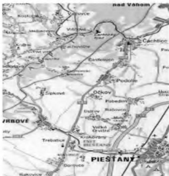
Geografická poloha obce