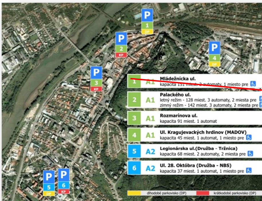
OBR. 1: Zaradenie parkovísk podľa pásma