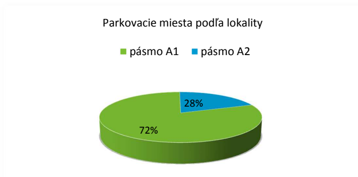
OBR. 2: Zastúpenie parkovacích miest podľa pásma