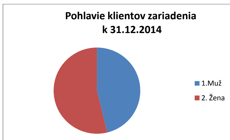
Graf č. 1: