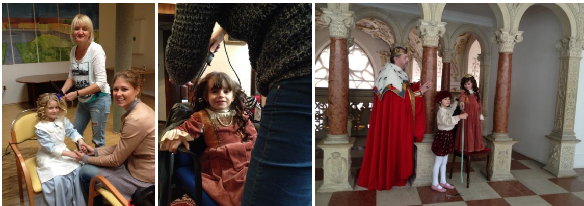
Navštívili sme aj Bojnický zámok, pre seniorov a deti to bol nádherný výlet