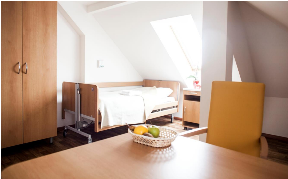
noposteľová izba pre seniorov s elektricky polohovateľným lôžkom v prevádzke Solčany

Prevádzka CSS Náruč záchrany Solčany, 1. Mája 47/42, 956 17 Solčany