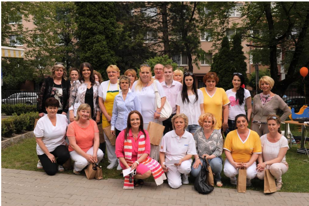
Vedenie a personál prevádzky CSS Náruč záchrany SENIOR&JUNIOR v Dúbravke

Prevádzka CSS Náruč záchrany Fedákova 5, 841 02 Bratislava