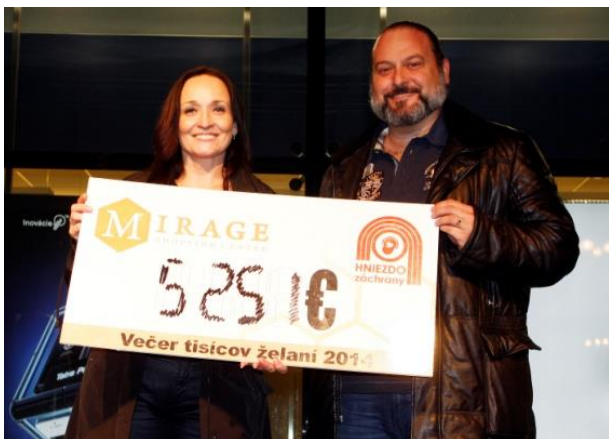
Dar pre šancu pre nechcených od Mirage Shopping Center v Žiline

Nadácii J&T Nadácii Tatrabanky Nadácii Markíza Nadácii Orange Nadácii ESET Nadácii Slovenskej sporiteľne Nadácii Dobré zo Slovenska Ministerstvu práce, sociálnych vecí a rodiny SR Slovenskej cestnej spoločnosti Mirage Shopping Center Spoločnosti PricewaterhouseCoopers Spoločnosti ZSE Nadácii Slovenskej sporiteľne Spoločnosti Neuerdoerfler Spoločnosti KON-RAD Spoločnosti AVICENUM Spoločnosti Kováč Trans Spoločnosti AMS Spoločnosti Hydrotour Spoločnosti NADRESS Spoločnosti IPOS-kancelárske potreby Spoločnosti Marco Mirelli Spoločnosti TPD Spoločnosti LINET Spoločnosti Babytrend Spoločnosti DM Spoločnosti CCC Slovakia