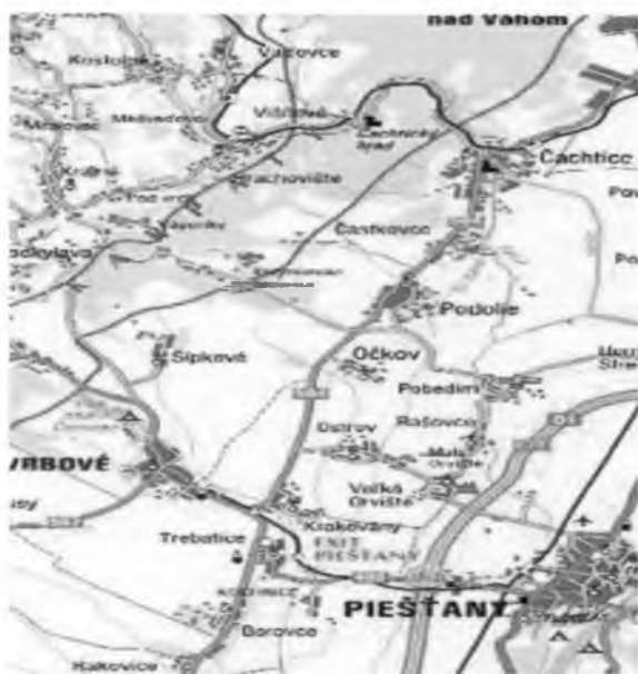
Geografická poloha obce