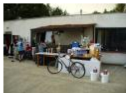
Jánsky futbalový turnaj