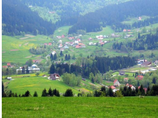
pohľad na Korňu

Obec Korňa je samostatný územný samosprávny celok Slovenskej republiky. Obec je právnickou osobou, ktorá za podmienok ustanovených zákonom, samostatne hospodári s vlastným majetkom a vlastnými príjmami. Základnou úlohou obce pri výkone samosprávy je starostlivosť o všestranný rozvoj jej územia a o potreby obyvateľov.