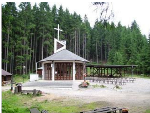
kaplnka na Živčákovej

Kostol Božského srdca Ježišovho Starý kostol zrekonštruovaný na pastoračné centrum Kaplnka a pútnické miesto na hore Živčáková Replika veterného mlyna v Nižnej Korni