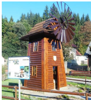
replika veterneho mlyna

Korňa, ktorá sa stretla s veľmi pozitívnym ohlasom návštevníkov. Oslava bola spojená s hodovými slávnosťami s bohatým kultúrnym programom.