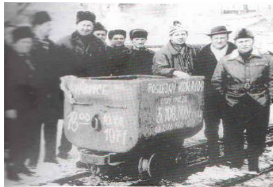
Posledný vagón s rudou vyvezený z bane