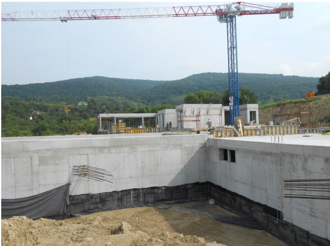
Súkromný športový klub Devín ▼