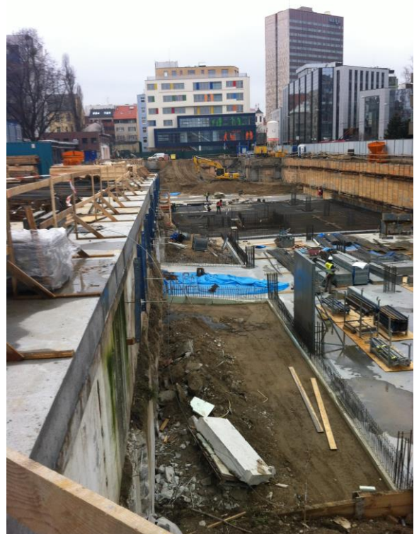
Nemocnica sv. Michala v Bratislave