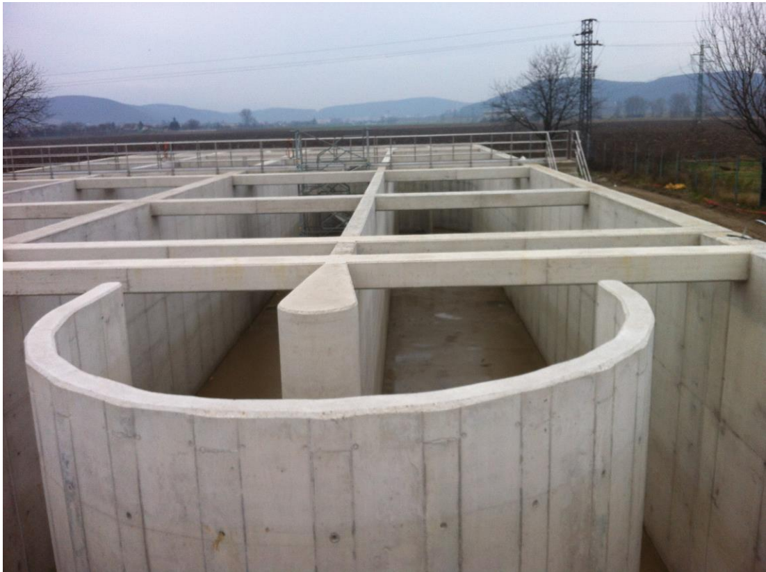
▲ Čistiareň odpadových vôd Trenčianska Teplá