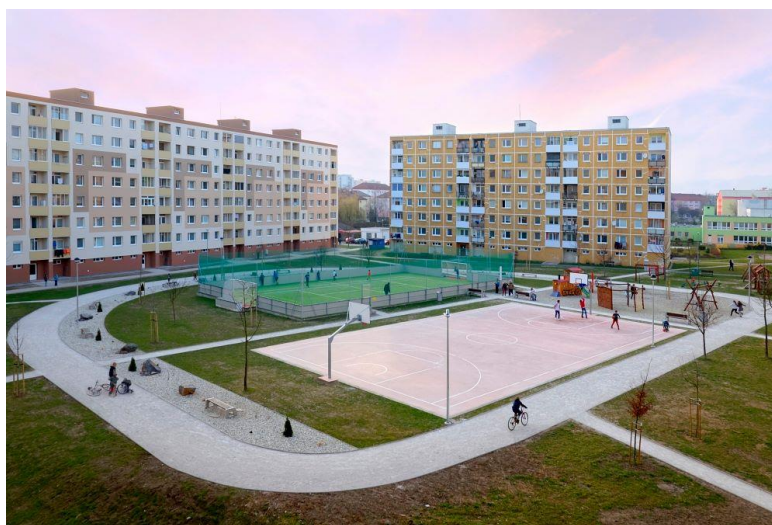
Oddychová zóna „Hviezdoška“