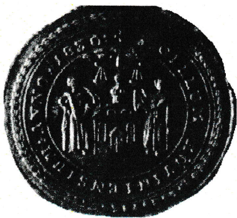
Pečať z roku 1830

Podkladom pre návrh erbu bola obecná pečať z prvej polovice 19. storočia. Odtlačok typária z roku 1830 je uložený v Krajinskom archíve v Budapešti v zbierke pečatí.