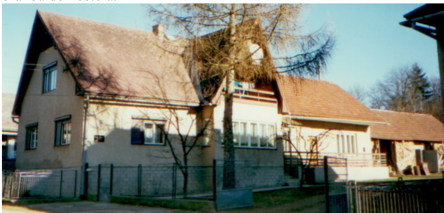
Budova novej fary