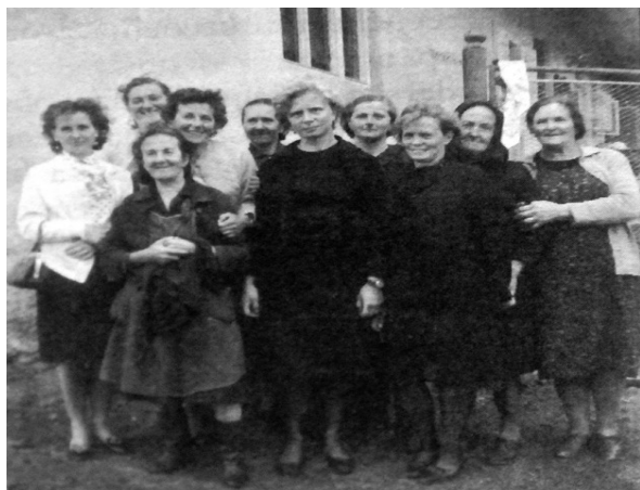
Táto fotografia vznikla pravdepodobne v 50 rokoch 20. storočia a vidíme na nej návštevu amerických migrantov v rodnej obci Kocel'ovce.