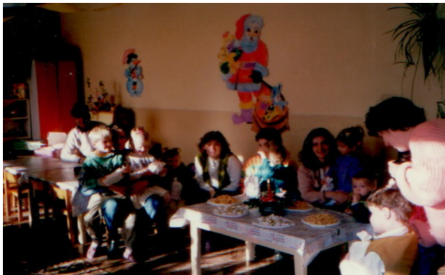
Mikuláš v Materskej škole v rokoch 1999