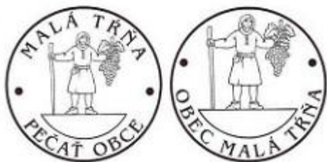
PEČATE OBCE MALÁ TRŇA

Pečať obce : Pečať obce má priemer 35 mm. V strede pečate je figúra z erbu, čiže postava roľníka s palicou a strapcom hrozna. V hornom segmente je názov obce Malá Trňa, odstredivo. V dolnom segmente je nápis – obec, dostredivo.