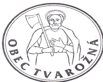
OBR. Č. 4: PEČAŤ OBCE TVAROŽNÁ

V pečati sa vyskytuje horná časť postavy svätého Mateja odedého v plášti, s gloriolou okolo hlavy, ako drží v pravej ruke sekeru opretú o plece.