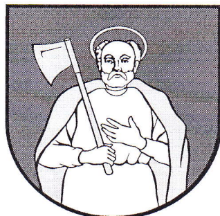
Obr. č. 2: Erb obce Tvarožná

Svätý Matej apoštol je patrónom farského rímskokatolíckeho kostola.