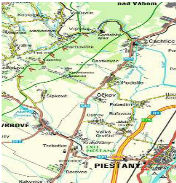
Geografická poloha obce