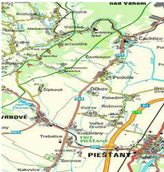
Geografická poloha obce