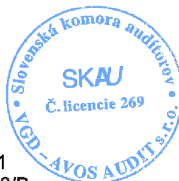
Bart Waterloos zodpovedný audítor Licencia SKAU č. 1029

VGD – AVOS AUDIT s.r.o. Moskovská 13, 811 08 Bratislava 1 Obchodný register, vložka č. 74698/B Licencia SKAU č. 269