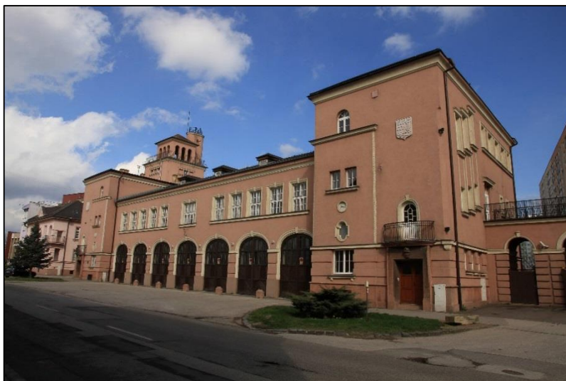
Obr. 8 Budova Okresného riaditeľstva hasičského a záchranného zboru