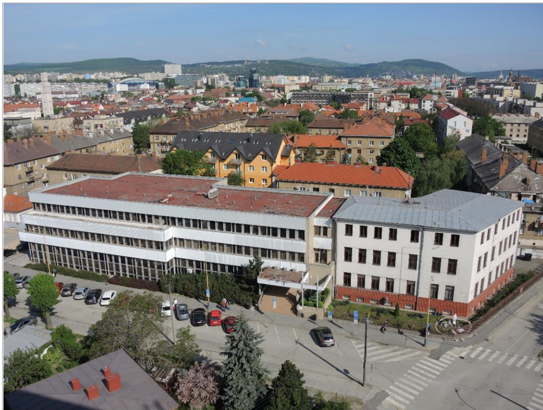
Obr. 2 Budova MÚ MČ Košice – Juh, Smetanova 4

Obecný úrad: Miestny úrad MČ Košice - Juh, Smetanova 4, Košice