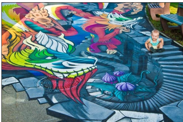
Obr. 40 Maľba 3D draka, ŠZA