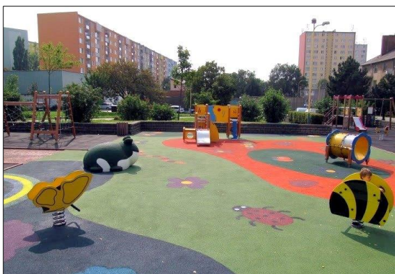
Obr. 20 Detské ihrisko Lienka