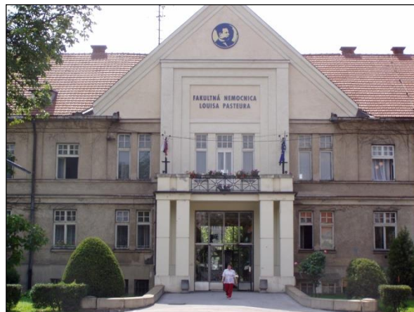
Obr. 10 Univerzitná nemocnica Luisa