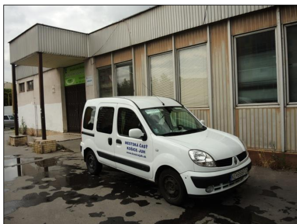
Obr. 14 Jedáleň pre dôchodcov, Vojvodská 5