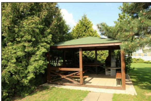
Obr. 42 Altánok, ŠZA