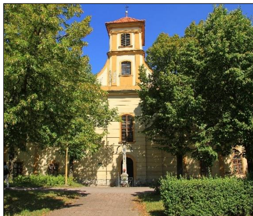
Obr. 6 Kostol Ducha svätého

Južná časť mesta sa začala formovať v období rozvoja obchodu ako prirodzené pokračovanie historického centra. Okolo vlastného územia stredovekých Košíc existovali menšie územné celky – prímestské osady, ktoré sa až do začiatku 16. storočia označovali ako villa, dorff, vicus, dörffel. Na juhovýchodnom predmestí sa rozprestierala Ludmanova Ves (villa Ludmani, resp. Ludmansdörfel) i Špitálska ulica; v juhozápadnej časti Bednárska Ves (Bindersdorf, či Bindergass).