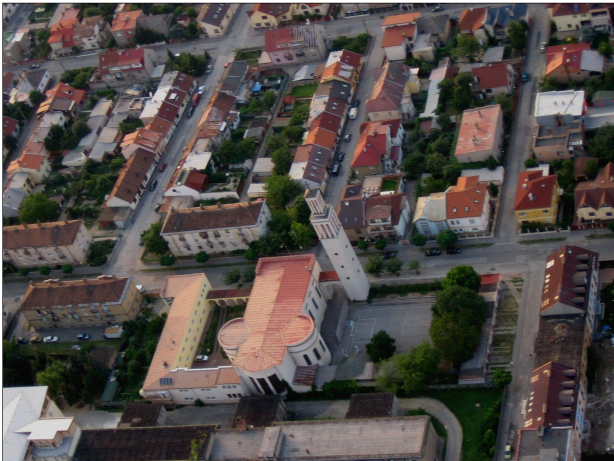
Obr. 4 Pohľad na MČ Košice – Juh z vtáčej perspektívy

Obec je samostatný územný samosprávny a správny celok Slovenskej republiky. Obec je právnickou osobou, ktorá za podmienok ustanovených zákonom samostatne hospodári s vlastným majetkom a s vlastnými príjmami. Základnou úlohou obce pri výkone samosprávy je starostlivosť o všestranný rozvoj jej územia a o potreby jej obyvateľov.