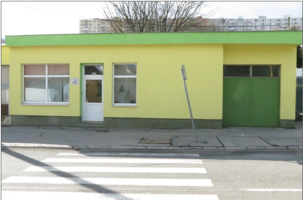
Obr. 3 Budova Miestneho podniku služieb, s.r.o. Košice, Rastislavova 63