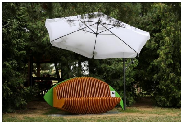
Obr. 41 Hovoriaca lavička, ŠZA