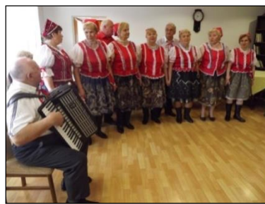
Obr. 24 Spevokol Ruža