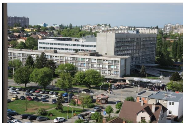
Obr. 12 a 13 Univerzitná nemocnica L. Pasteura