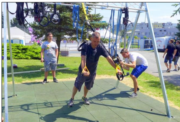
Obr. 45 TRX systém, ŠZA