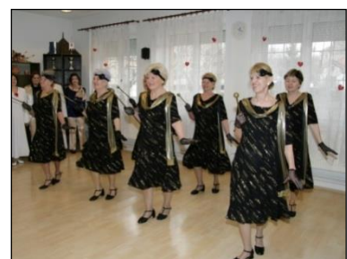
Obr. 25 Súbor Diamant

V priestoroch centra návštevníci nájdu tieto možnosti využitia: relaxačný bazén s vírivkami s rozlohou 4,5 x 8,5 m, kapacitou 6 osôb/h, sauny pre 4 až 5 osôb, posilňovňu, služby masérov, stolný tenis, kolky, tenis v letnom období, internet, prenájom priestorov a rôzne druhy pohybových aktivít.