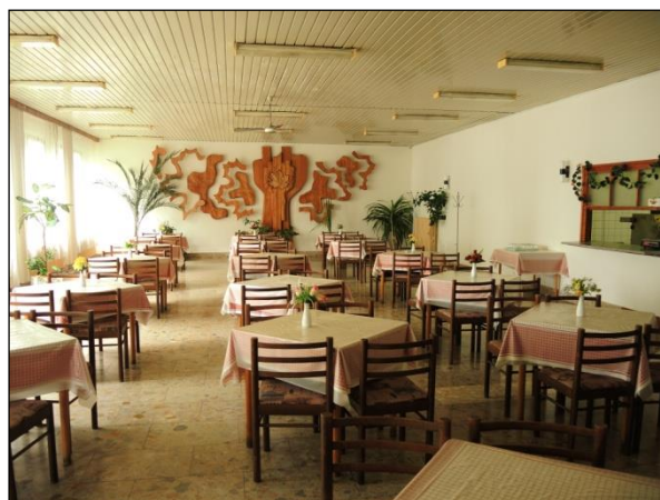
Obr. 15 Interiér Jedálne pre Dôchodcov