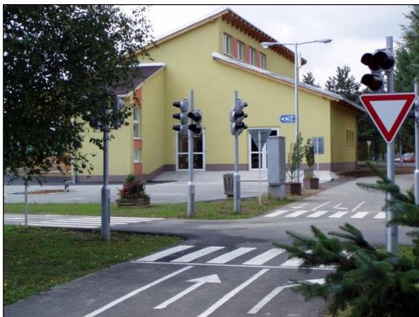
Obr. 27 Dopravné ihrisko ŠZA