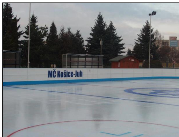
Obr. 29 Ľadové ihrisko ŠZA

Umelá ľadová plocha: v decembri 2006 bola sprístupnená verejnosti umelá ľadová plocha o rozmeroch 20x40 m s umelým chladením a osvetlením, je vybavená profesionálnymi mantinelmi, hokejovými brámkami, ochrannými sieťami a striedačkami, plochu je možné využívať od novembra do marca za predpokladu denných teplôt do +12 st. Celzia, využíva sa na verejné korčuľovanie, amatérsky hokej, tréningovú činnosť hokejových tried ako aj na športovo-zábavné akcie pre obyvateľov mesta Košice. V roku 2014 sme pre najmenších korčuľiarov zabezpečili pomôcku na ľad – 2 pinquinov a 2 pandy, ktoré sú nápomocné deťom pri prvých krokoch na ľade.