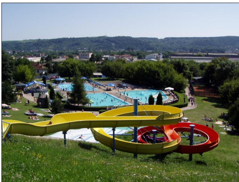
Obr. 46 Kúpalisko Triton s tobogánom

Letné kúpalisko Triton je jedno z najkrajších kúpalísk v Košiciach. Ponúka verejnosti tri neplavecké bazény. Jeden pre dospelých, vhodný aj na plávanie, jeden relaxačný a bazén s drevenou šmýkačkou pre deti. Návštevníci môžu využívať aj štvorprúdovú šmýkačku s dojazdovým bazénom a tobogánom – jediným v Košiciach. V areáli sa nachádza ihrisko pre