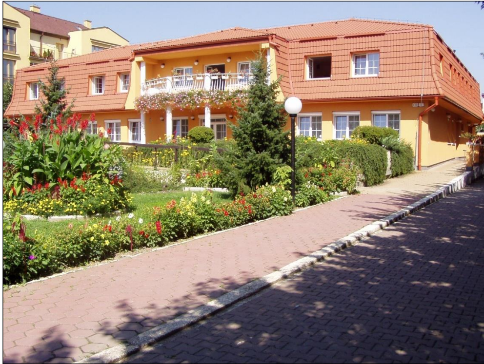
Obr. 22 Budova Spoločensko-relaxačného centra, Milosrdenstva 4

Dôchodcovia organizujú rôzne podujatia v rámci krúžkovej činnosti: krúžok šikovných rúk, racionálnej výživy, turistický, športový – stolný tenis, kolky, šípky, šachy, tenis, kultúrno-spoločenský krúžok, organizujú rôzne tuzemské aj zahraničné zájazdy, majú k dispozícii knižnicu aj klubovňu.