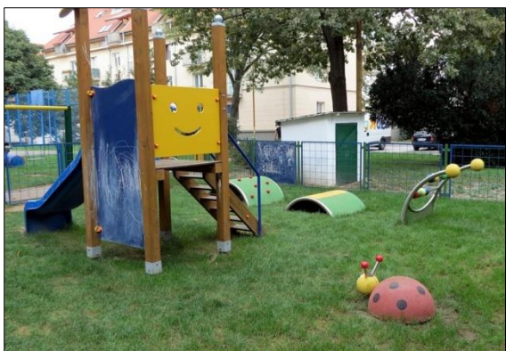
Obr. 18 Detské ihrisko Gaštanová