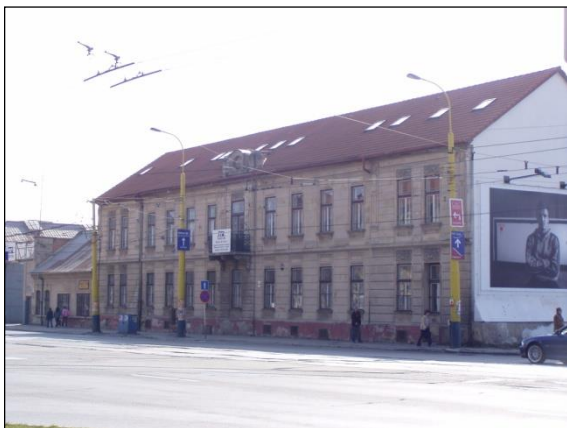
Obr. 5 Siposova továreň