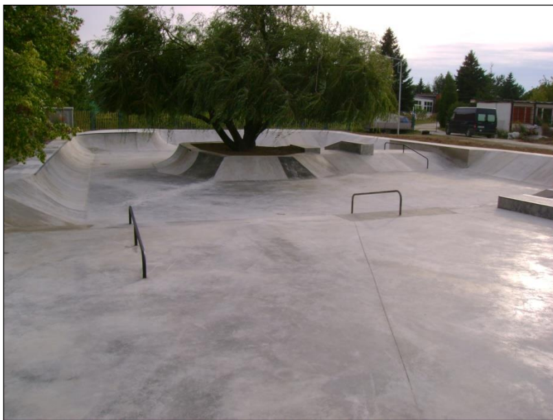
Obr. 35 a 36 Skate park ŠZA

Budova areálu: v priestoroch budovy je k dispozícii bufet, biliard, detské hry, stolný futbal, tenis a vonku letná terasa, na prvom poschodí sa pravidelne koná dopravná výchova pre deti spojená s premietaním po skončení dopravnej výchovy vedenej príslušníkmi polície, budova sa dá prenajať k rôznym spoločenským podujatiam ako napríklad oslavy narodenín.