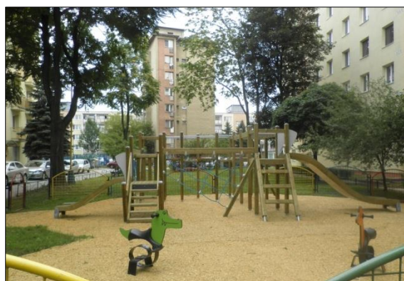
Obr. 21 Detské ihrisko Rastislavova