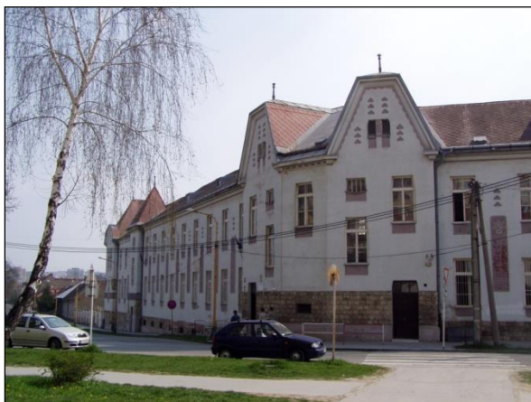
Obr. 9 Budova Strednej zdravotníckej školy Pasteura