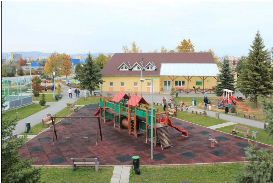
Obr. 26 T-Systems Športovo-zábavný areál, Alejová 2

Mestská časť Košice – Juh je vlastníkom a správcom Športovo zábavného areálu na Alejovej 2 v Košiciach o rozlohe 22 546 m 2 , ktorý denne navštívi veľa detí, športovcov, občanov a návštevníkov mesta Košice. Tento areál je prispôsobený všetkým vekovým kategóriám, a tak tu starší ľudia využívajú možnosť zahrať si stolný tenis, šípky, šachy, žiaci a stredná generácia využíva multifunkčné ihriská, dopravné ihrisko, skate park, mobilnú ľadovú plochu a najmladšia generácia sa zahrá na detskom ihrisku. V roku 2014 sme na areáli pokrstili maskota „Vranku“, ktorá sa stala milou atrakciou na organizovaných podujatiach.