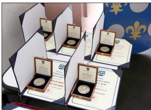
Obr. 11 Udeľovanie verejných ocenení

Klinika rádiodiagnostiky a nukleárnej medicíny UN LP Košice – za mimoriadny prínos v oblasti zdravotníckej starostlivosti o pacientov