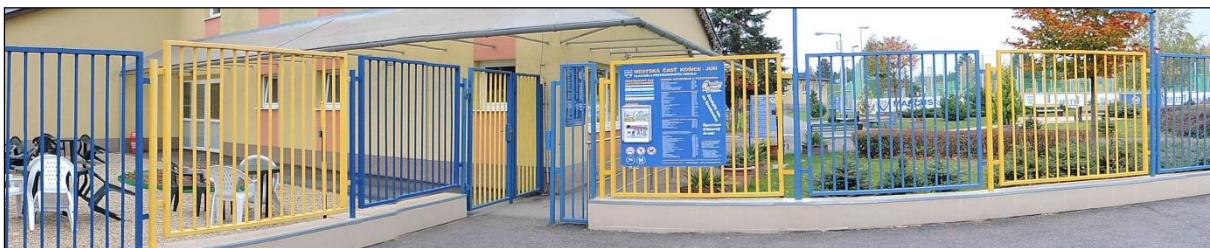
Obr. 37 Vstupná brána T-Systems Športovo-zábavný areál, Alejová 2

Budova areálu: v priestoroch budovy je k dispozícii bufet, biliard, detské hry, stolný futbal, tenis a vonku letná terasa, na prvom poschodí sa pravidelne koná dopravná výchova pre deti spojená s premietaním po skončení dopravnej výchovy vedenej príslušníkmi polície, budova sa dá prenajať k rôznym spoločenským podujatiam ako napríklad oslavy narodenín.