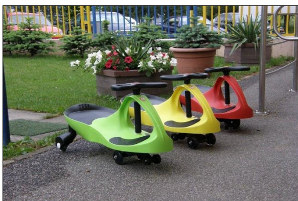
Obr. 43 Odražadlá pre deti, ŠZA