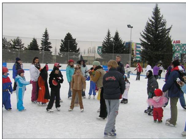
Obr. 30 Karneval na ľadovom ihrisku ŠZA

Amfiteáter: s kapacitou 500 divákov bol zrekonštruovaný pre organizovanie kultúrno-spoločenských podujatí, sú v ňom vytvorené priaznivé podmienky pre organizovanie koncertov, festivalov, firemných a propagačných akcií, k dispozícii je javisko s ozvučením a zázemím ako šatne, hygienické a sociálne zariadenia pre verejnosť.