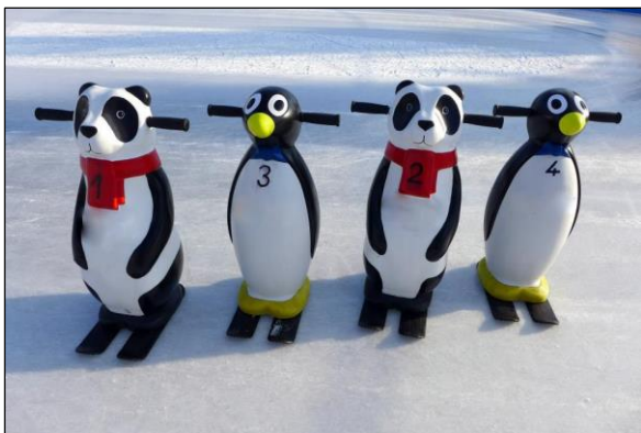
Obr. 44 pomôcka na korčuľovanie, ŠZA