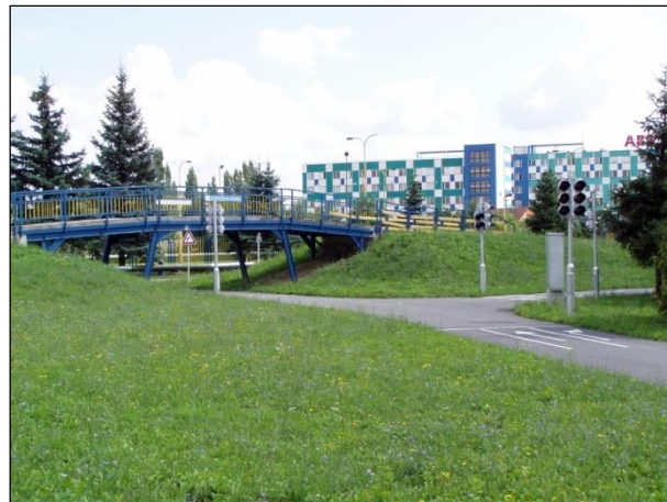
Obr. 28 Dopravné ihrisko ŠZA - nadjazd

Umelá ľadová plocha: v decembri 2006 bola sprístupnená verejnosti umelá ľadová plocha o rozmeroch 20x40 m s umelým chladením a osvetlením, je vybavená profesionálnymi mantinelmi, hokejovými brámkami, ochrannými sieťami a striedačkami, plochu je možné využívať od novembra do marca za predpokladu denných teplôt do +12 st. Celzia, využíva sa na verejné korčuľovanie, amatérsky hokej, tréningovú činnosť hokejových tried ako aj na športovo-zábavné akcie pre obyvateľov mesta Košice. V roku 2014 sme pre najmenších korčuľiarov zabezpečili pomôcku na ľad – 2 pinquinov a 2 pandy, ktoré sú nápomocné deťom pri prvých krokoch na ľade.