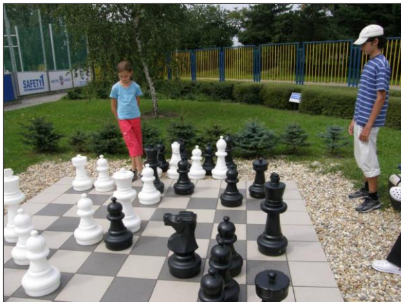
Obr. 38 Exteriérové šachy, ŠZA

Atrakcie areálu ŠZA ako napríklad hovoriaca lavička, stroje na cvičenie, jazierko, 3D maľba draka, exteriérové šachy, altánok a veľa ďalších skvelých možností trávenia voľného času pre všetky vekové kategórie. Od roku 2014 môžu návštevníci areálu využívať aj cvičenia na exteriérovom TRX systéme.