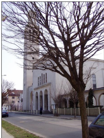
Obr. 7 Kostol Kráľovnej pokoja