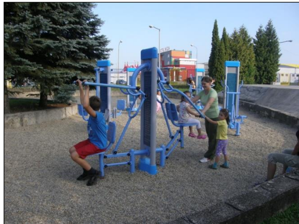
Obr. 39 Exteriérová posilňovňa, ŠZA