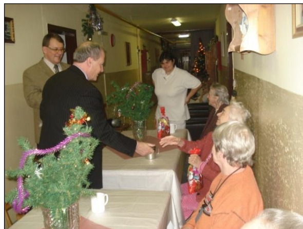
Obr. 16 Vstup do Zariadenia opatrovateľskej služby, Mlynárska č. 1 Obr. 17 Vianoce v ZOS

MČ Košice - Juh v rámci iných sociálnych činností poskytuje jednorazové dávky občanom v hmotnej núdzi, monitoruje nelegálne osady, poskytuje materiálnu pomoc občanom a rodinám v hmotnej a sociálnej núdzi formou poskytovania potravín, obuvi, odevov, školských potrieb, hračiek a kníh, zabezpečuje starostlivosť o deti z rodín v hmotnej núdzi formou poskytovania školských potrieb pri nástupe do prvého ročníka ZŠ a organizovaním Mikulášskej nádielky, organizuje pre bezdomovcov pred vianočnými sviatkami štedrovečerné spoločenské posedenie, organizuje v spolupráci s obchodným reťazcom Kaufland a firmou Labaš s.r.o. Košice akciu „Daruj kilečko“ zameranú na získavanie potravín pre občanov v hmotnej a sociálnej núdzi. Organizuje zbierky obuvi, odevov, hračiek, kníh a školských potrieb. Spolupracuje s verejnými a neverejnými poskytovateľmi sociálnych služieb a subjektmi, ktoré sa podieľajú na riešení sociálnych problémov obyvateľov MČ.