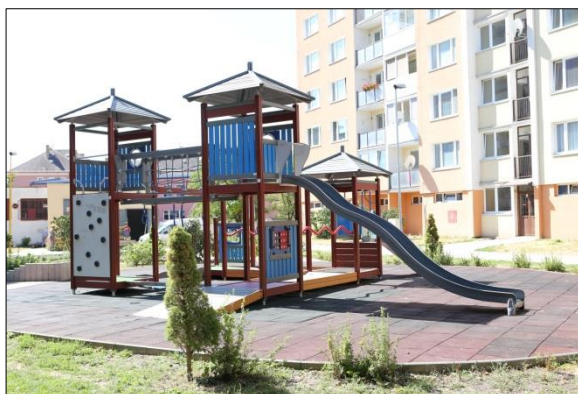
Obr. 19 Detské ihrisko Ludmanská