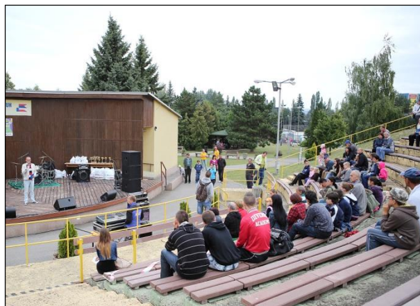
Obr. 31 Deň otvorených dverí – mažoretky