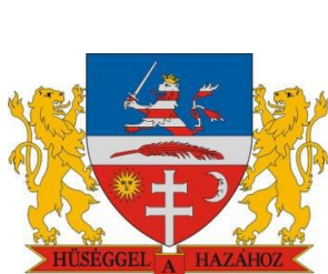
Bonyhád Maďarská republika