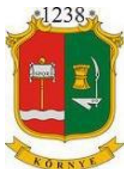
Környe Maďarská republika