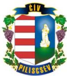
Piliscsév Maďarská republika