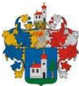
Nagyatád Maďarská republika