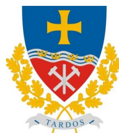
Tardos Maďarská republika