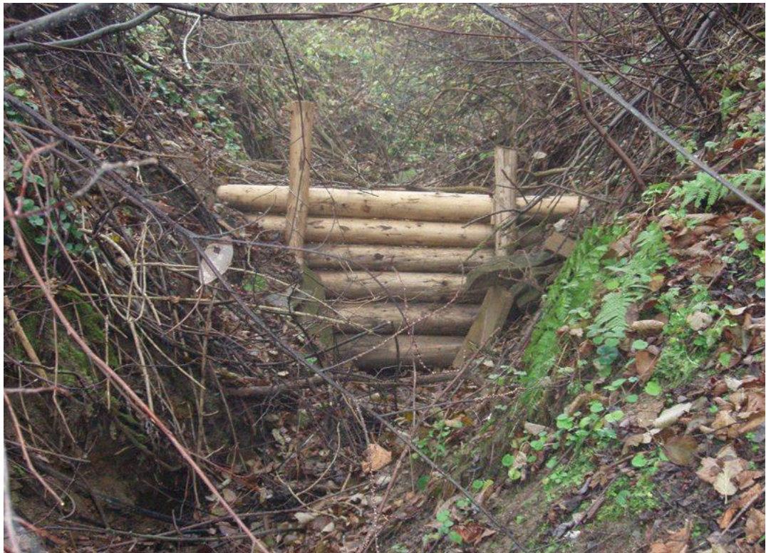
Obr. .2 Protipovodňové hrádze