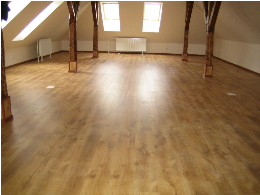
Obr. . 3 Vybavenie Sociocentra