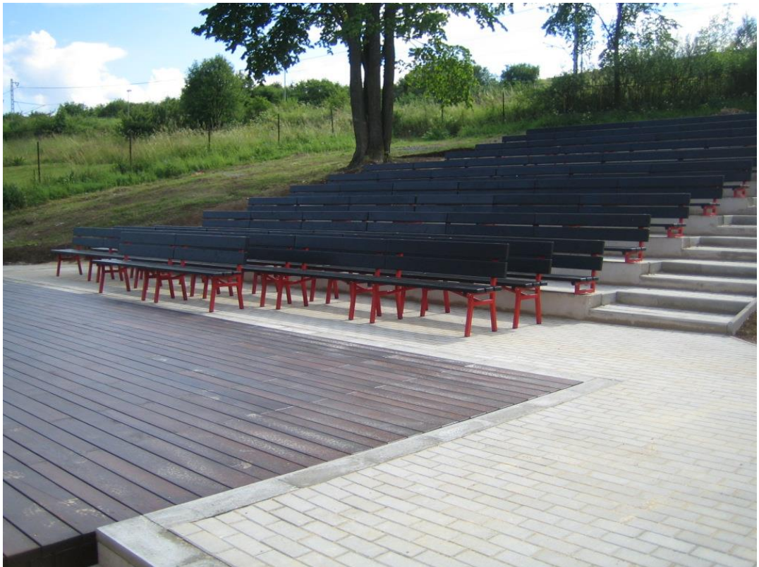
Obr. .1 Amfiteáter za Polyfunkčným centrom