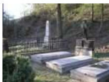
Nachádzajú sa na miernom terénnom vyvýšení za tzv. Franklinovským kaštieľom.