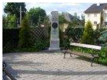
Pamätník sa nachádza v areáli Dolného kaštieľa

Juraj (György) Lahner (* 22. október 1795 Nécspály, † 6. október 1849 Arad (Rumunsko)) jeden z generálov uhorskej revolúcie v roku 1848. Popravený spolu s ďalšími v Arade, v maďarskej literatúre spomínaní ako Aradskí mučeníci