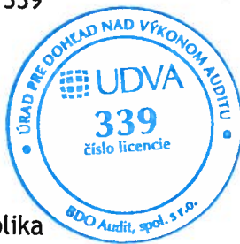
BDO Audit, spol. s r. o. Licencia UDVA č. 339

22. decembra 2015 Zochova 6-8 Bratislava, Slovenská republika