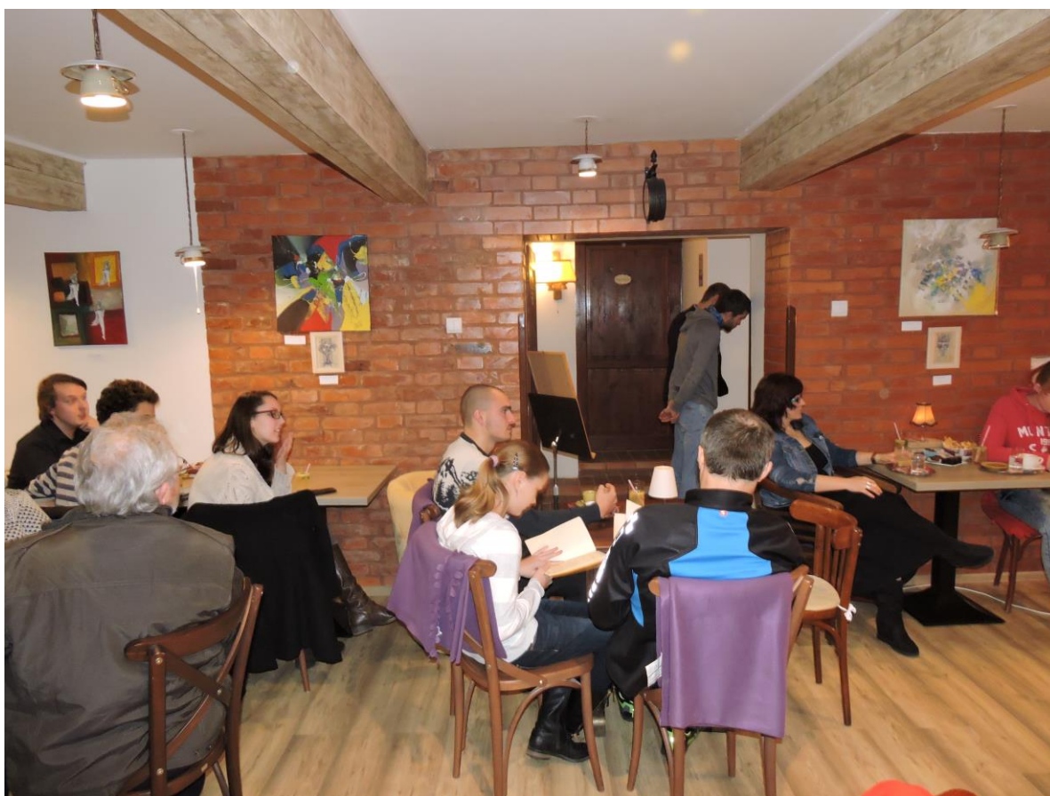
Vernisáž obrazov...A bola farba, 29.11.2015, Carmel café

Carmel café využili aj jednotlivci a menšie skupiny k zorganizovaniu menších stretnutí, schôdzí, osláv a pod. (napr. školenie farárov RKCS, pracovné schôdze prípravných tímov BMW, tímu besiedkárov...)