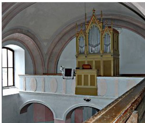
Organ z roku 1908