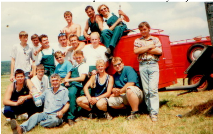
Dobrovoľný hasičský zbor z roku 2002