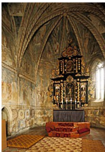
Barokový oltár pochádza z roku 1740