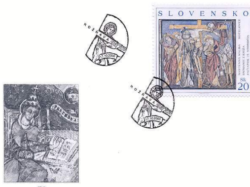
Známka obce: Nástenná maľba Kocel'ovce, Snímanie z kríža začiatok 15. storočia 20 Sk