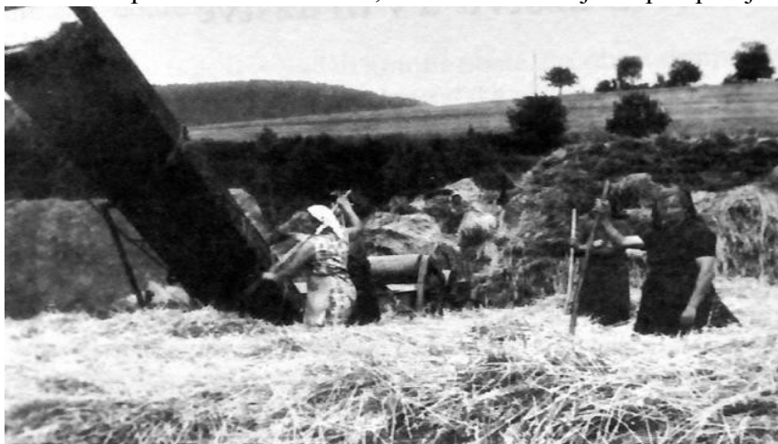
Táto fotografia pochádza zo šesťdesiatych rokov 20. storočia a vidíme na nej pracovníkov miestneho jednotného roľníckeho družstva pri zbere sena

V roku 1959 založili Kocel'ovčania JRD. Postupne sa vybuďoval hodpodársky dvor na hone Za vodou pod Dúbravou. Od šesťdesiatych rokov mali aj pridruženú stavebnú výrobu. Kocel'ovčania si v družstve počínali veľmi dobre, družstvo bolo najviac prosperujúce v Štítnickej doline.