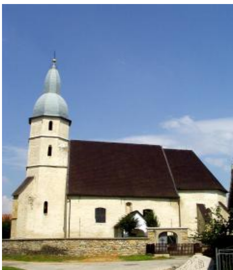
Gotický evanjelický kostol zo 14. storočia, patrí medzi najvýznamnejšie na Slovensku