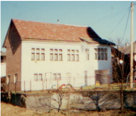
Budova Materskej školy postavená svojpomocne obyvateľmi v 60 rokoch