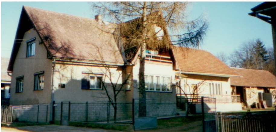
Budova novej fary