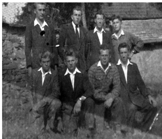
Táto fotografia vznikla okolo roku 1960 vidíme na nej osem členov Dobrovoľného hasičského zboru Kocelovce