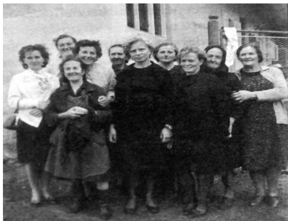
Táto fotografia vznikla pravdepodobne v 50 rokoch 20. storočia a vidíme na nej návštevu amerických migrantov v rodnej obci Kocel'ovce.