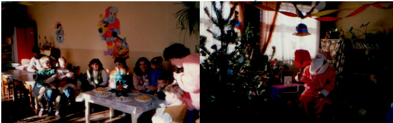
Mikuláš v Materskej škole v rokoch 1999

V súčasnosti výchovu a vzdelávanie detí v obci poskytuje: