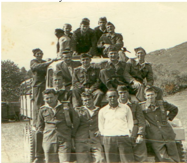
Dobrovoľný hasičský zbor z roku 1959

Dobrovoľný hasičský zbor vznikol v Kocelovciach v roku 1928 a na začiatku mal 20 členov. Vrchol v početnosti získal v roku 1980, keď mal 50 členov. Aktívny je dodnes, vystriedalo sa v ňom už päť generácií a zúčastňuje sa rôznych hasičských súťaží, o čom svedčí bohatá zbierka rôznych ocenení uložených v obci.