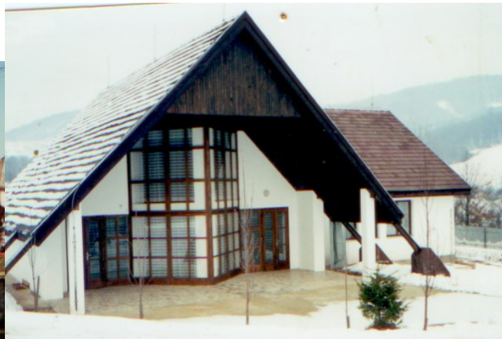
Budova Domu Smútku dokončená výstavba v roku 1998