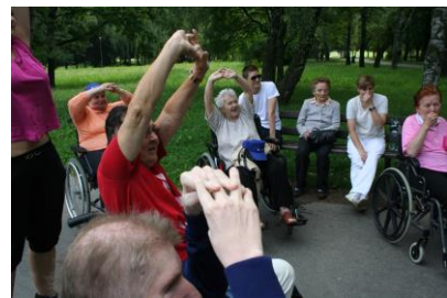
Zariadenie pre seniorov