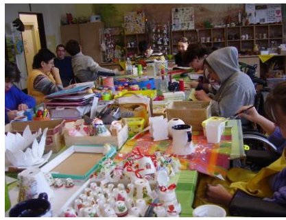
Tím chránenej dielne