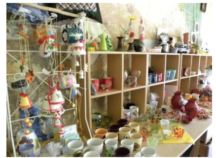
Výrobky chránenej dielne