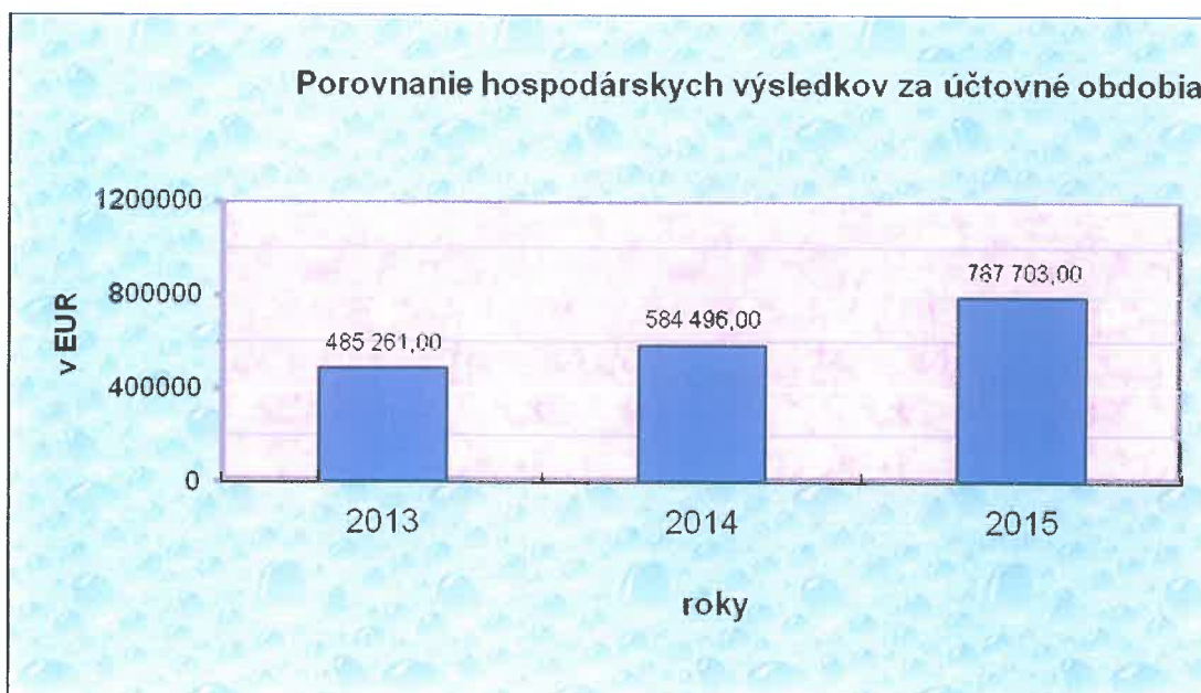
Tabuľka č. 4