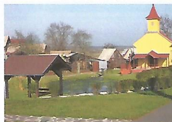
-Kostol kráľa sv. Ruženca z r. 1935 vo Fil. Kľáčanoch