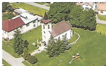
-Rímskokatolícky secesný kostol sv. Ladislava z r. 1899