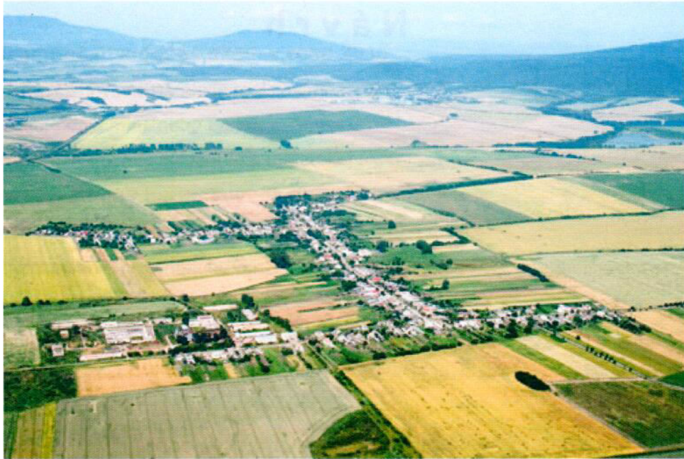
Letecká snímka dediny