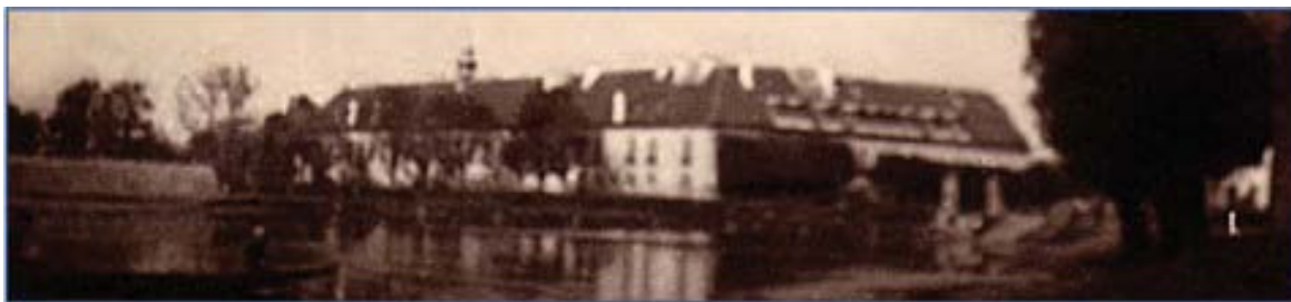
Pôvodný kaštieľ rodu Pálffyovcov (fotografia z roku 1935)

Prvé stavebné začiatky Krmeša nachádzame na križovatke ciest v smere z Kráľovej pri Senci do Senca, pri kríži, ktorý dodnes symbolizuje miesto kaplnky, ktorá bola centrom bývalej obce a stála až do roku 1700, kedy dal ostrihomský arcibiskup Leopold Kollonich zbúrať jej rúmu. Úplný koniec Krmeša v priestore križovatky ciest v smere na Senec znamenali turecké nájazdy v roku 1663, ktoré v tomto roku počas nájazdu 23. augusta okrem hospodárskych stavísk, pustovne a kaplnky starého Krmeša vypálili aj obce Kráľovú, Jánovce, Boršu a Senec. Zo zbúranej kaplnky a