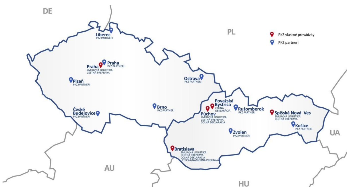
Obr.: Geografická pôsobnosť skupiny PKZ