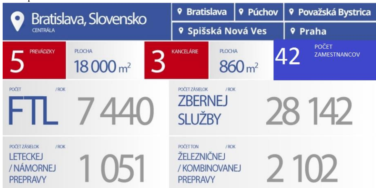
Grafické porovnanie údajov v číslach v roku 2015 oproti roku 2014