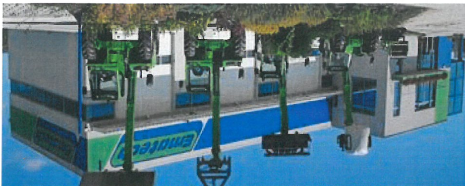
Ematech, s.r.o. Piešťanská 3/3 95605 Radošina