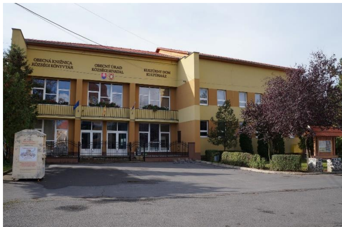
KOSTOL SV. ŠTEFANA KRÁĽA A KULTÚRNY DOM V BISKUPICIACH