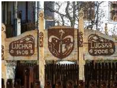
Pamätná tabuľa pri príležitosti 600 rokov od prvej zmienky