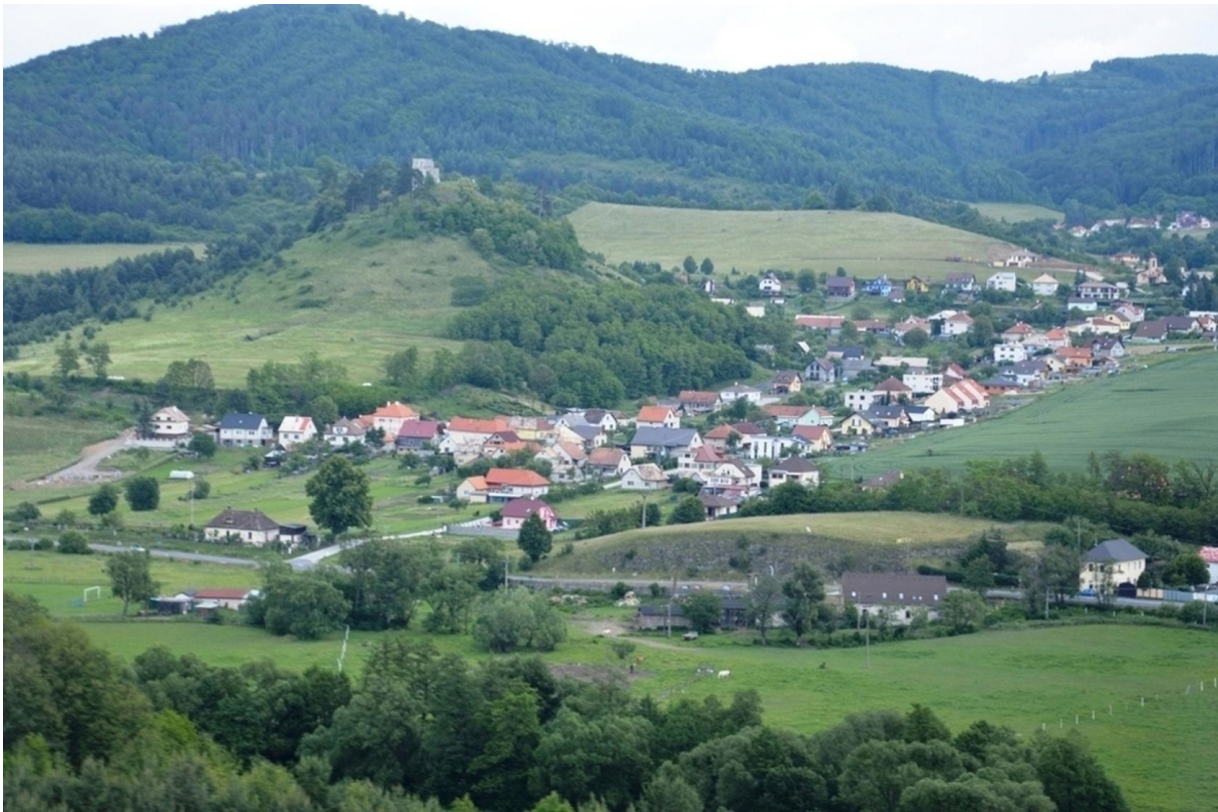
Pohľad na Podzámčok