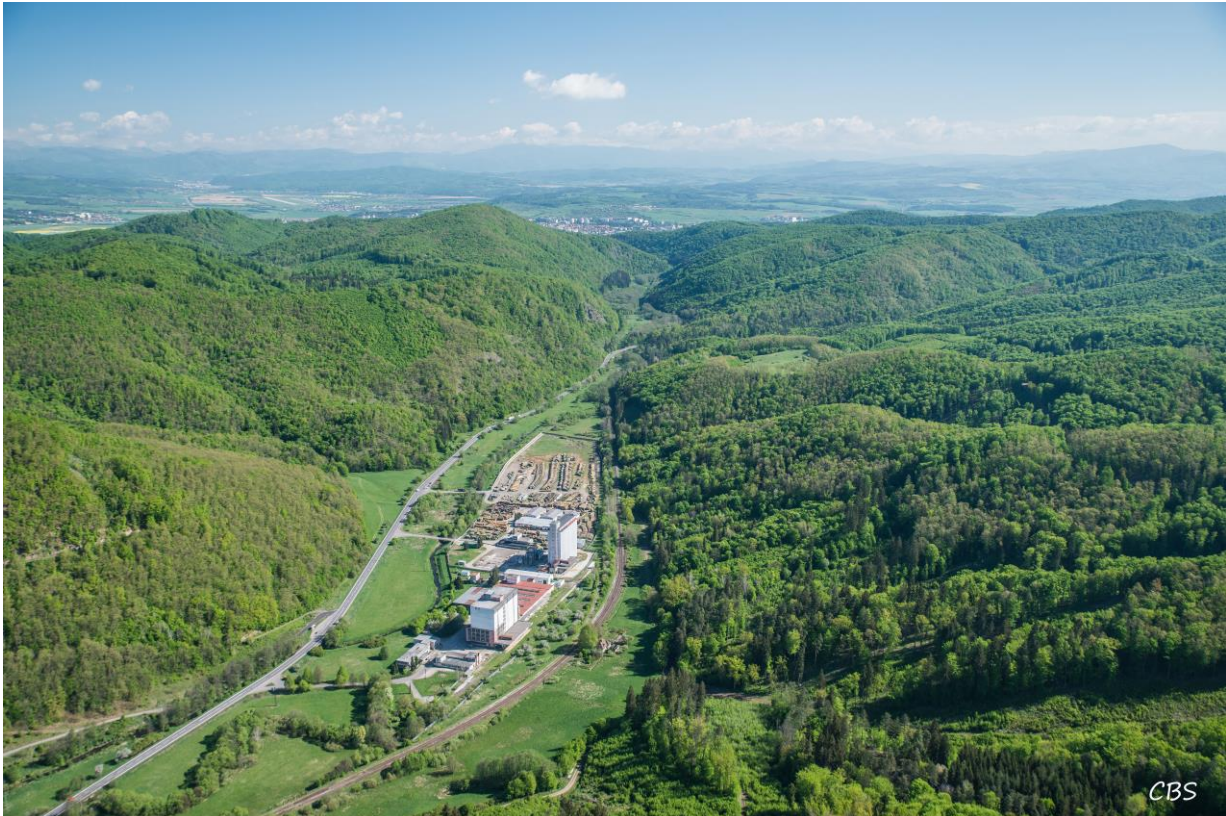
Priemyselný areál Breziny