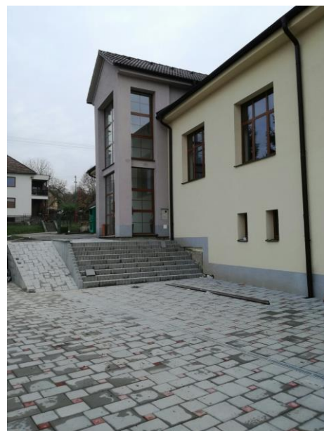
Zábery počas prác na kultúrnom dome a multifunkčnom ihrisku