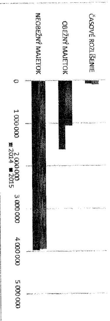
Vybrané údaje aktiv