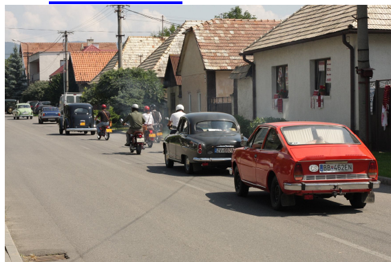
Veteráni prechádzajú Očovou počas konania OFH.