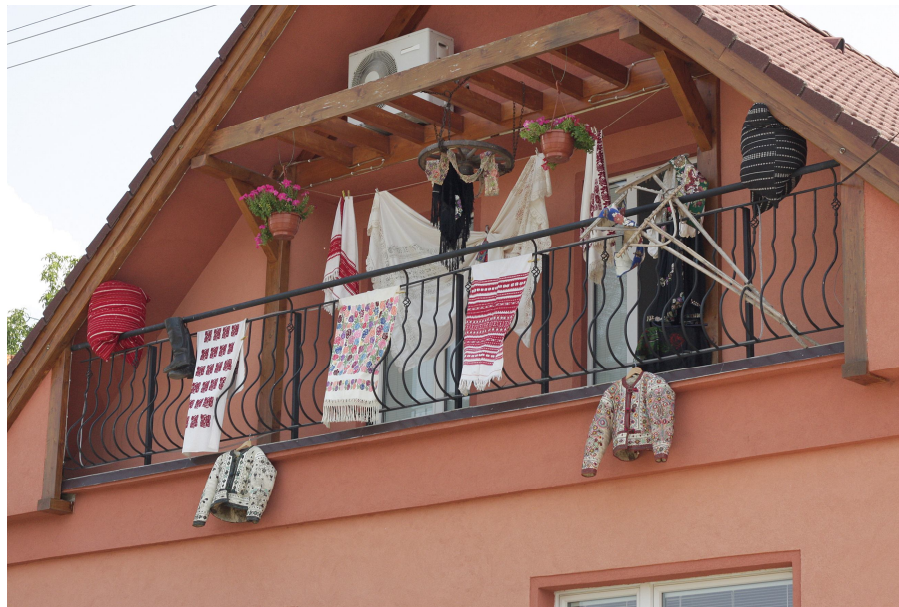
Súťaž o najkrajšie priečelie rodinného domu počas konania OFH.

Poľnohospodárske družstvo Očová je transformované z Jednotného roľníckeho družstva Očová, ktorého začiatky sa datujú od 19. júla 1949. Družstvo systémom nájmu obhospodaruje 4576 ha pôdy od 1345 oprávnených osôb. (Z toho je 2003 ha ornej pôdy a 2573 ha trvalých trávnych porastov. V živočíšnej výrobe sa družstvo zameriava na chov hovädzieho dobytku mliečného typu prevažne holsteinského plemena a chov oviec. Družstvo poskytuje prácu cca pre 100 členov a zamestnancov družstva. Deň poľa družstvo organizuje od r. 1995 každoročne, ako celoslovenský Deň poľa s predvádzaním strojov na zber krmovín.