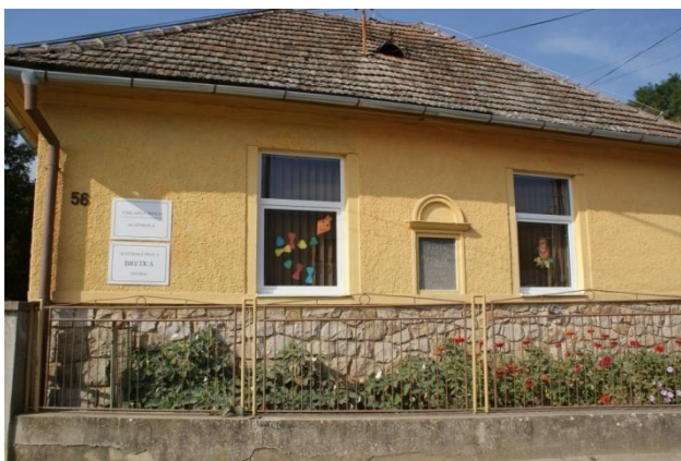
Budova školy a škôlky

Na základe analýzy doterajšieho vývoja možno očakávať, že rozvoj vzdelávania sa bude orientovať na skvalitňovanie výchovno – vzdelávacieho procesu.