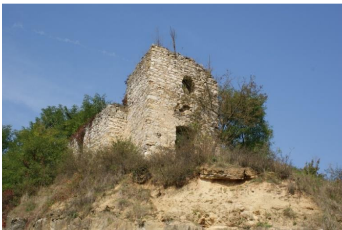
Kaplnka Andreja apoštola

Najvýznamnejšou pamiatkou obce je kaplnka sv. Andreja apoštola postavená v eklektickom historizujúcom slohu. Nachádza sa na skrasovatenom brale nad miestnou základnou školou.