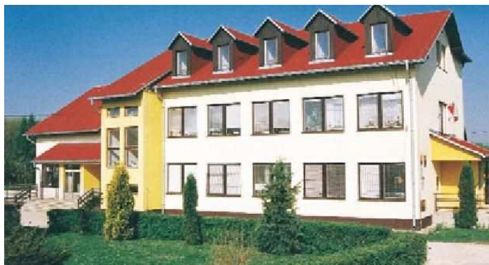
Obecný úrad s kultúrnym domom

Spoločenský a kultúrny život v obci sa orientuje na miestne akcie a podujatia v kultúrnom dome v Chmeľnici, ktorý má sálu s pódium. V tejto budove sídli aj Obecný úrad. Obec zabezpečuje konanie kultúrnych a spoločenských akcií – Deň matiek, Dni nemeckej kultúry, Deň obce, novoročný ples, akcie pre deti a Mikuláš. V budove je zriadená obecná knižnica – knižničný fond sa dopĺňa pravidelne, občania si vypožičiavajú knihy rôzneho žánru.