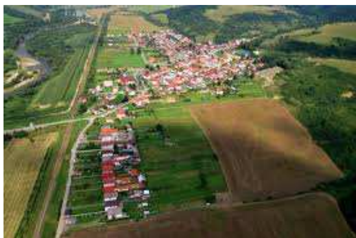
Letecký pohľad na obec Chmeľnica

Obec obklopuje krásna a čistá príroda, kde možno nájsť kamenný výtvor „Čertovu skalú“, ktorá je vysoká 12 m a spája sa s ňou povest' spojená s výstavbou Ľubovnianskeho hradu, ale aj pozoruhodné bradlo Ľubovnianskej vrchoviny Marmon. Ide o strmú stenu z červeného, hľúznateho, karpionelového vápenca, ktorý sa tu v minulosti ťažil a používal ako stavebný kameň, ale aj okrasný mramor na pomníky a pamätne tabule. Najbližšou významnejšou historickou pamiatkou je Ľubovniansky hrad vzdialený od obce len zopár kilometrov.