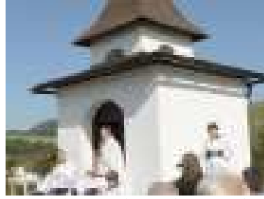
Kaplnka Nanebovzatia P. Márie