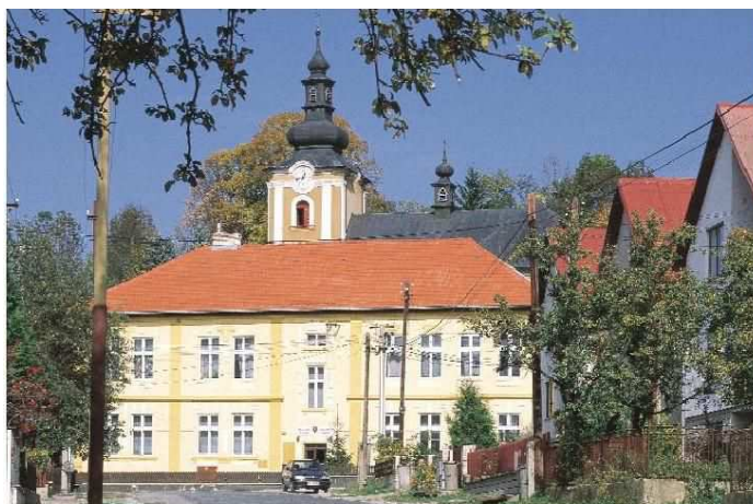
Základná škola s materskou školou

V súčasnosti výchovu a vzdelávanie detí v obci poskytuje: