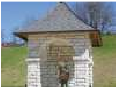
Kaplnka sv. Floriána