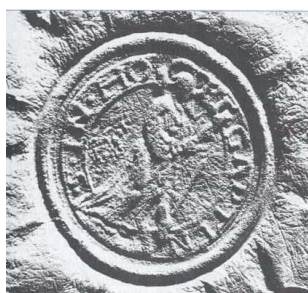
Pečatidlo z 19.storočia

Pečať je okrúhla, so symbolom obce uprostred a kruhospisom OBEC CHMEĽNICA