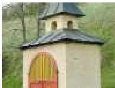
Kaplnka sv. Barbory