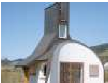
Kaplnka sv. Jána Nepomuckého