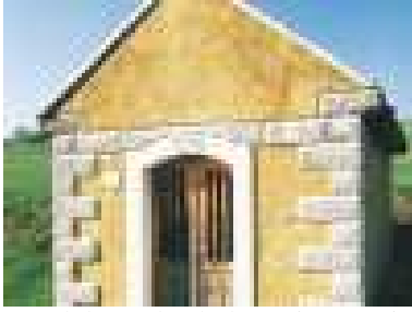
Kaplnka Sedembolestnej P. Márie