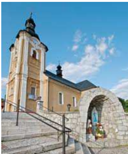
Kostol svätého Andreja