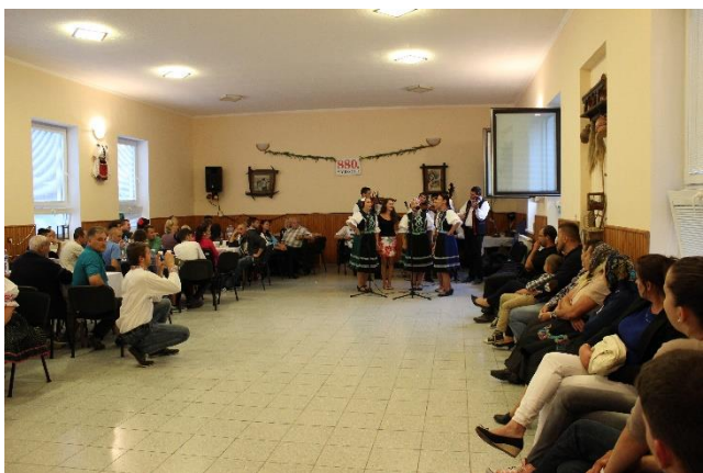
Obrázok 7 Večerná zábava na 880. výročí obce

Oblasť športu v našej obci reprezentuje Telovýchovná jednota TJ Čabrad-Dolný Badín založená v roku 1976, ktorá dodnes reprezentuje aj našu obec v oblastnej futbalovej súťaži. Pre zdravý životný štýl a vyplňanie voľnočasových aktivít nielen detí bolo v roku 2005 vybudované multifunkčné ihrisko s antukovým povrchom, kde sa usporadúvali rôzne súťaže v tenise, nohejbale a volejbale. V zimnom období sa na ihrisku vytvárala umelá ľadová plocha. V rokoch 2012 a 2013 obec usporiadala oblastnú súťaž v ľadovom hokeji. V roku 2014 bolo ihrisko zrekonštruované pokládkou umelej trávy. V zimnom období sa v interiéroch obecných budov usporadúvajú turnaje v stolnom tenise ako aj regionálny mariášový turnaj.