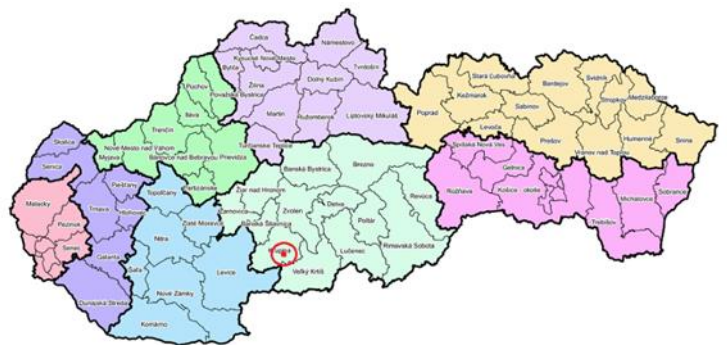
Obrázok 1 Geografická poloha obce