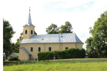
Obrázok 3 Rímskokatolícky kostol sv. Michala

Vnútorňú časť kostola tvorí jedna loď na priečelí s oltárom, na ktorom vyniká obraz sv. Michala s anjelmi v boji proti satanovi. Po bokoch obrazu sa nachádzajú sochy sv. Petra a sv. Pavla. Na bočných stenách kostola sú sochy Panny Márie, Sv. Terézie, Ježiša