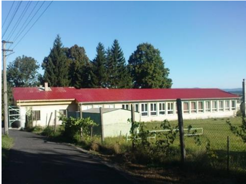
Obrázok 4 Budova ZŠ Dolný Badín