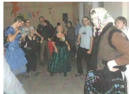
Obrázok 5 Fašiangový maškarný ples

Spoločenský a kultúrny život v obci zabezpečuje obecný úrad v spolupráci s aktívnymi občanmi. Obecná knižnica bola v roku 2012 zlúčená so školskou knižnicou a celý knižný fond prenesený do základnej školy. V obci sa združuje ZO Jednota klub dôchodcov Slovenska. V obci je kultúrny dom, v ktorom sa organizujú rôzne kultúrne akcie, napr. fašiangový maškarný ples a posedenie pre dôchodcov. Okrem toho naša obec organizuje pre našich občanov ďalšie rôzne spoločenské podujatia, ako Deň detí a Jánska vatra,