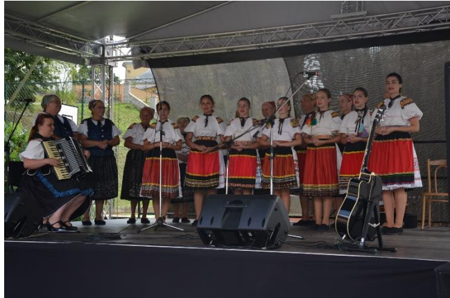
Obrázok 6 FS Badínčanka na 880. výročí obce

vd'aka ktorým sa môžu obyvatelia spolu stretnúť a zabaviť. Aj v uplynulom roku 2015 bol obcou vo februári zorganizovaný tradičný fašiangový maškarný ples, v júli sa pri príležitosti Dňa detí cestovalo na kúpalisko, v októbri sa konalo tradičné posedenie pre dôchodcov. Najvýznamnejšou udalosťou v obci v roku 2015 boli oslavy 880. výročia obce konané začiatkom septembra za účasti občanov obce, rodákov obce a ostatných hostí s bohatým kultúrnym programom. Pri tejto príležitosti bola vydaná aj brožúra o obci.