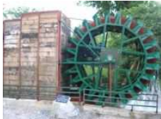
Prvá obecná vodná elektrárň na Slovensku v Necpaloch

- Obec Necpaly má funkčnú prvú obecnú vodnú elektrárň na Slovensku. Spustená do skúšobnej prevádzky bola 19.7.2007.