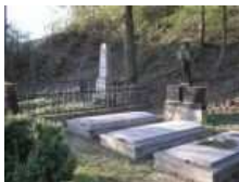
Nachádzajú sa na miernom terénnom vyvýšení za tzv. Franklinovským kaštieľom.