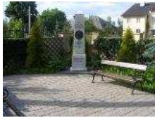
Pamätník sa nachádza v areáli Dolného kaštieľa