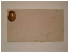
Pamätná tabuľa sa nachádza v predsieni Evanjelického kostola v Necpaloch