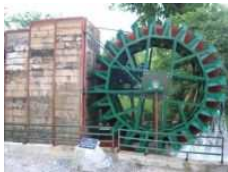
Prvá obecná vodná elektrárň na Slovensku v Necpaloch

- Obec Necpaly má funkčnú prvú obecnú vodnú elektrárň na Slovensku. Spustená do skúšobnej prevádzky bola 19.7.2007.