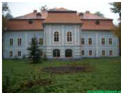
Stav v roku 2002

Dátum vzniku tohto kaštieľa nie je presne známy, z hľadiska stavebného vývoja a slohového zaradenia sa jedná o budovu, ktorá vznikla zo staršej renesančnej stavby, datovanej do 17. storočia, prestavanej a prefasádovanej v 2. polovici 18. storočia do dnešnej barokovo-klasticistickej podoby.