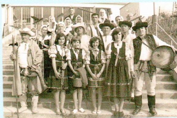
Dožinky-Folklórny súbor Ledničanka

Obec Lednica je známa aj svojím kultúrnym životom. Zachovávajú sa tu tradičné zvyky, napr. Fašiangy, Tri krále či Veľká noc. V spolupráci s folklórnou skupinou sa každoročne usporadúvajú Dožinkové slávnosti spojené s tradičným jarmokom, pripravuje sa pre deti športový deň na Deň detí, Posedenie s dôchodcami, Vianočný koncert v kostole, a pod. Okrem snahy o zachovanie a udržanie starých zvykov sa folklórna skupina úspešne prezentuje aj vystúpeniami na rôznych kultúrnych podujatiach po celom okolí i na blízkej Morave.