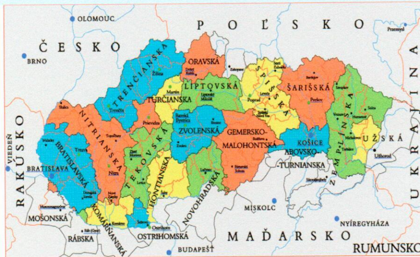
Mapa stolíc 1785-1790

Hranice stolíc sa ustálili v 15. storočí. Na Slovensku existovalo od 14. storočia do roku 1802 (s výnimkou 1785 - 1790) týchto 21 stolíc: