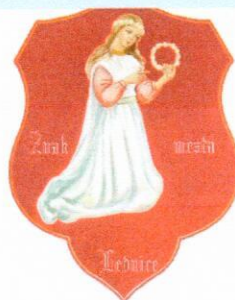
Erb obce Lednica