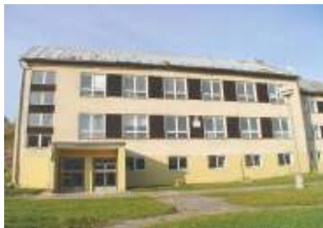
Základná škola s materskou školou

V súčasnosti výchovu a vzdelávanie detí v obci poskytuje len materská škola. V základnej škole od 1.9.2013 neprebíhal vyučovací proces a k 31.8.2014 bola základná škola s materskou školou vyradená zo siete škôl. Do siete škôl bola k 1.9.2014 zaradená materská škola bez právnej subjektivity a školská jedáleň.