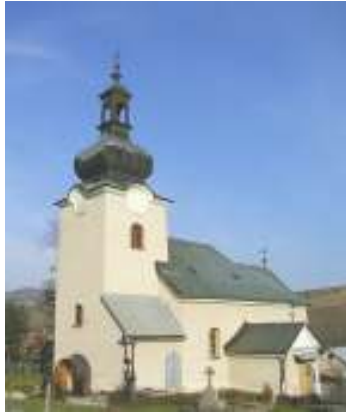
Chrám sv. archanjela Michala