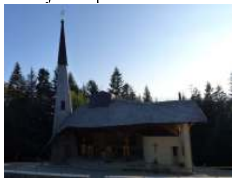
Pútnické miesto Hora Zvir