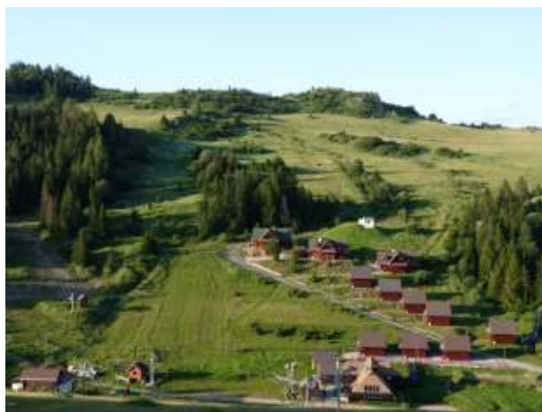
Lyžiarsky areál Skicomp Fakľovka

Lyžiarsky areál Skicomp Fakľovka ponúka rôzne sklony a profily zjazdových tratí v nadmorskej výške od 690 do 920 m. Stredisko s tromi veľkými vlekmi a jedným malým detským vlekom pre nenáročných lyžiarov. Celková prepravná kapacita 2000 osôb za hodinu. Z hľadiska geografickej polohy je stredisko veľmi výhodne situované vďaka čomu je dostatok snehovej pokrývky počas celého zimného obdobia. Lyžiarske svahy sú umelo zasnežované a osvetlené. Z vrcholu Fakľovky (945 m) je pekný výhľad na okolitú prírodu i Vysoké Tatry. V stredisku je možnosť kompletných stravovacích služieb v štýlovej čajovni goralského typu a bufetu priamo na svahu. Je tu tiež požičovňa lyžiarskeho výstroja a ski-servis. Návštevníci sa môžu ubytovať priamo v lyžiarskom areáli v zrubových chatách.