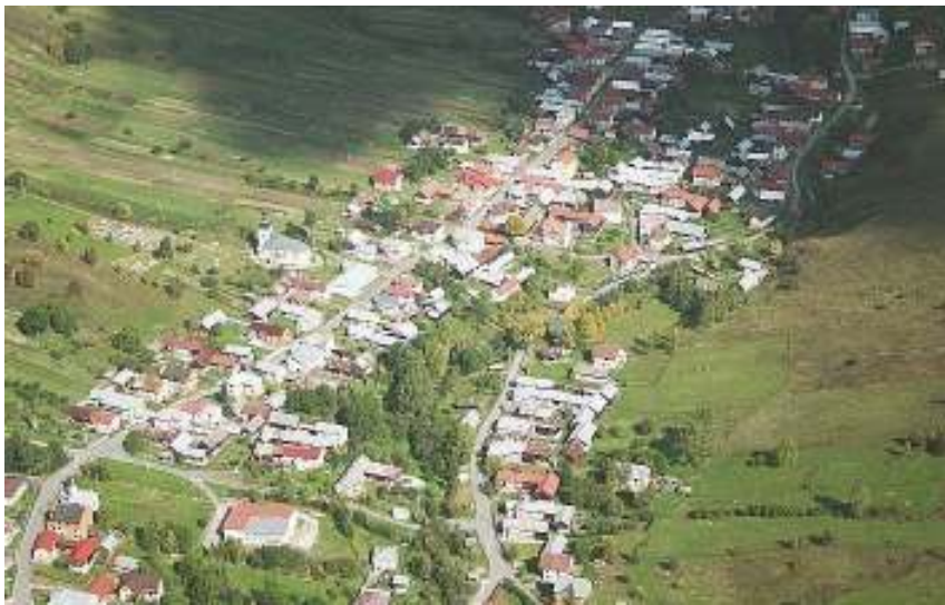
Letecký pohľad na Obec Litmanová

Obec bola ako majetok Ľubovnianskeho panstva v zálohu v Poľsku do roku 1772. Roku 1822 sa poddaní vzbúрили proti robotám. Roku 1828 obec mala 162 domov a 1185 obyvateľov - najviac počas svojej existencie. V obci bolo silné vyst'ahovalectvo. Obyvatelia boli známi drotári a sklári. Po roku 1918 si obec zachovala poľnohospodársko-pasienkársky ráz. Počas SNP obyvatelia podporovali na okolí operujúce partizánske skupiny. Obec bola oslobodená 24. 1.1945. Po roku 1945 bola v obci zavedená elektrická sieť /1960/, miestny rozhlas, verejné osvetlenie a postavená budova Jednoty SD, budova MNV /1958/, kultúrny dom /1978/, kasárne finančnej stráže, požiarna zbrojnica, budova školy /1982/, vodovod /1990/, miestne komunikácie, objekty JRD a ďalšie stavby.